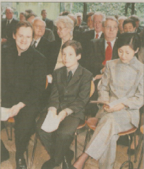
Im Oktober 2002 erhielt der aus Duisburg stammende Geigenvirtuose Frank Peter Zimmermann das Musicprize.

Zu den Anklagen fürs Museum gehört u.a. eine panathenäische Pseudo-Pantheon um 520 v.Chr. sowie ein „Weihestein“ für die Artemis von Ephesos, der sich später als Fälschung entpuppte (wir berichteten).